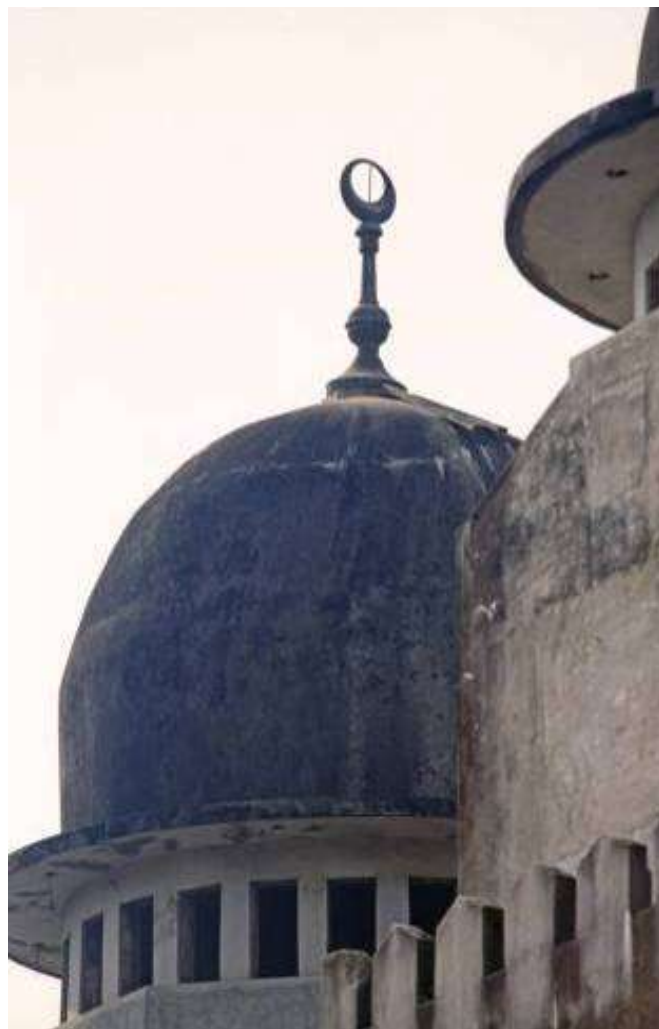
A mosque in Liberia